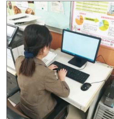
パソコンを使った事務作業の訓練

担っています。私は障害者就労への理解促進や就労支援センターの機能啓発を目的として、区内の産業団体やハローワーク、特別支援学校、就労支援移行事業所などで構成する「目黒区障害者就労促進連絡会」を立ち上げてきました。