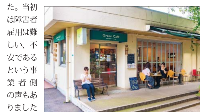
障害者が一般就労をめざす訓練施設 グリーンカフェ西郷山

担っています。私は障害者就労への理解促進や就労支援センターの機能啓発を目的として、区内の産業団体やハローワーク、特別支援学校、就労支援移行事業所などで構成する「目黒区障害者就労促進連絡会」を立ち上げてきました。